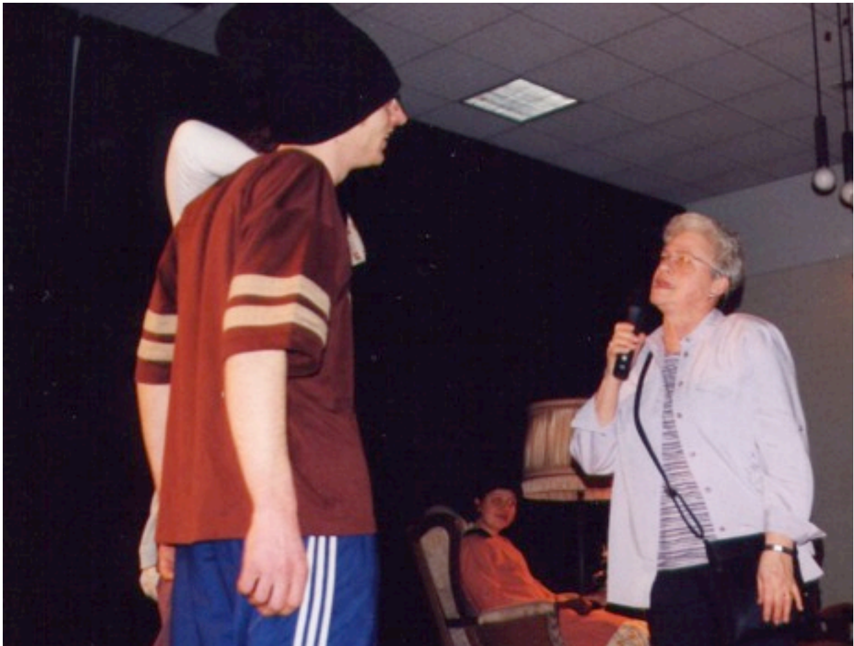
Bewoner geeft het voorbeeld

Discussietheater kan ingezet worden om vele uiteen lopende onderwerpen op een laagdrempelige wijze bespreekbaar te maken. Essentie is, dat het om situaties gaat, die door mensen en dus gedrag veroorzaakt worden. Op de website www.ludiek.net wordt nader ingegaan op twee veelgehoorde onderwerpen die spelen in de woonomgeving en waar Ludiek ervaring in heeft opgedaan de afgelopen jaren. Dit is het thema omgang tussen jongeren en ouderen (op straat) en de toepassing van discussietheater bij het bespreekbaar maken en oefenen van elkaar aanspreken op gedrag.